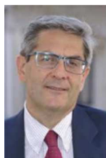
Roberto Tasca Assessore al Bilancio e Demanio del Comune di Milano

Classe 1962, sposato con due figli, nel 1986 ha conseguito la Laurea in Economia Aziendale con specializzazione in Mercati finanziari internazionali. Attualmente è Professore Ordinario di Economia degli Intermediari Finanziari presso l'Università degli Studi di Bologna (sede di Forlì) ed è titolare dello Studio Tasca, società specializzata in operazioni straordinarie e nella consulenza tecnica in procedimenti civili e penali, in materia di finanza d'impresa e di mercato.