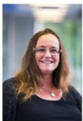
Jill Atkins Management School University of Sheffield, UK

Vicepresidente della Società italiana di Management, associazione dei docenti italiani di economia e gestione delle imprese.